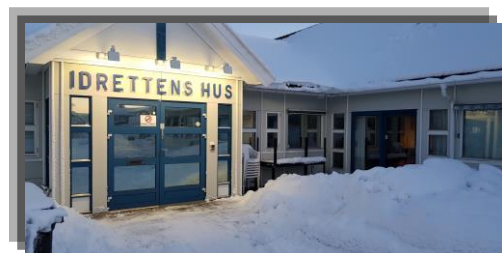
Idrettens Hus i Sandefjord