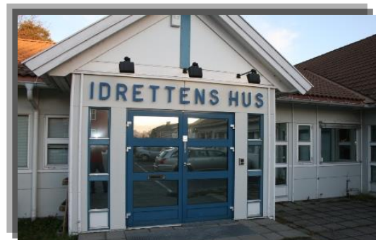
Idrettens Hus i Sandefjord