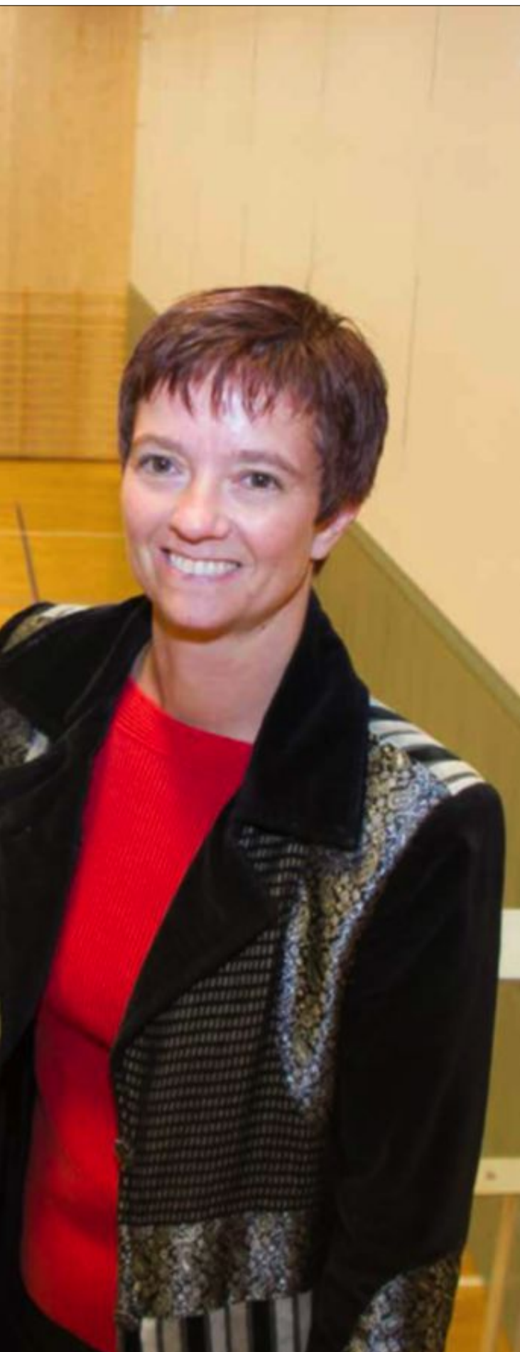
idrettskretsen. Her er hun i idrettshallen på nye Søreide skole som er med i AktiVane. Barna