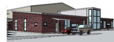
Ungdomsklubb & aktivitetssenter