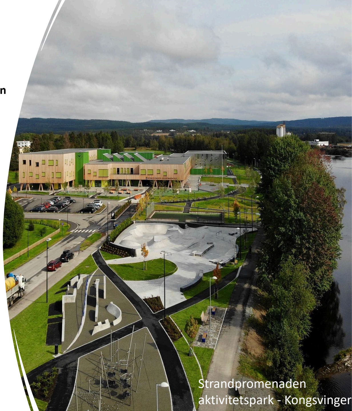
Strandpromenaden aktivitetspark - Kongsvinger