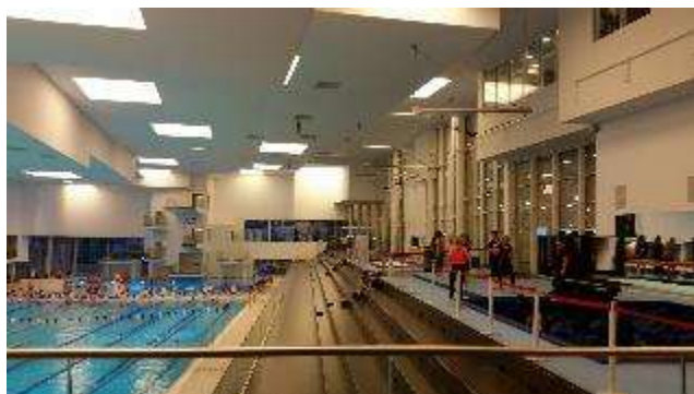
Fylkeskommunalt investeringstilskot til anlegg for nasjonale og internasjonale meisterskap