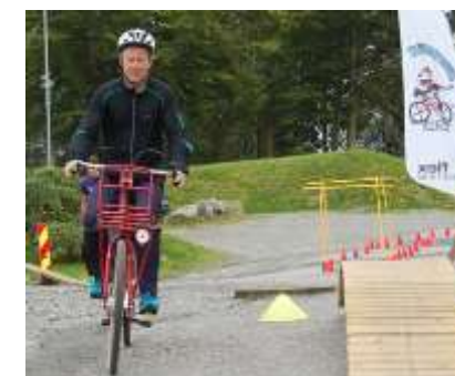
Kurs og konferansar