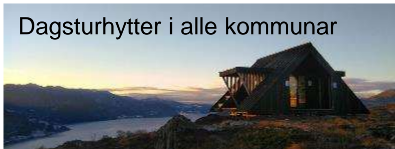
Dagsturhytter i alle kommunar