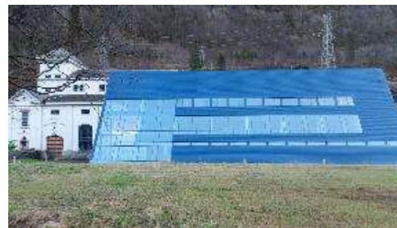
Fylkeskommunalt investeringstilskot til kommunar som ikkje har idrettshall eller symjehall