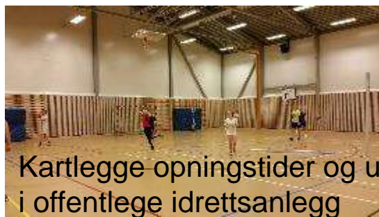
Kartlegge opningstider og utleigeprisar i offentlege idrettsanlegg