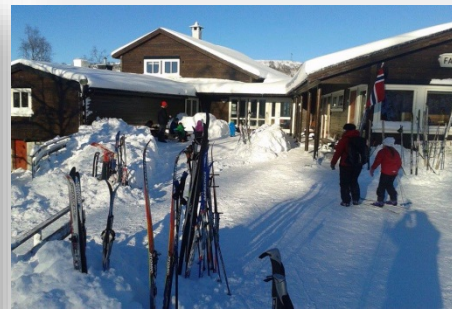
Fanahytten/Fanaløypen: Tur- og skiløyper for trening, konkurranser og mosjon