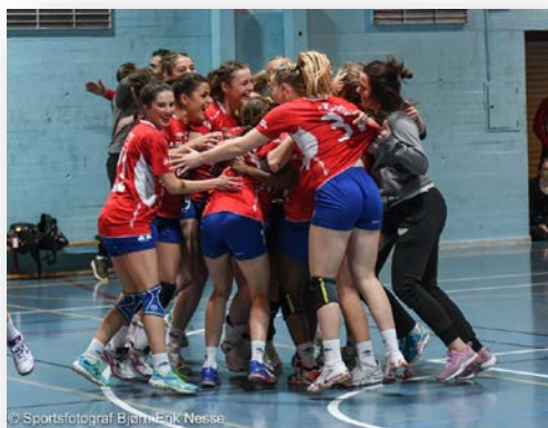
Fana Arena Håndball/Turn/Dans/Basket