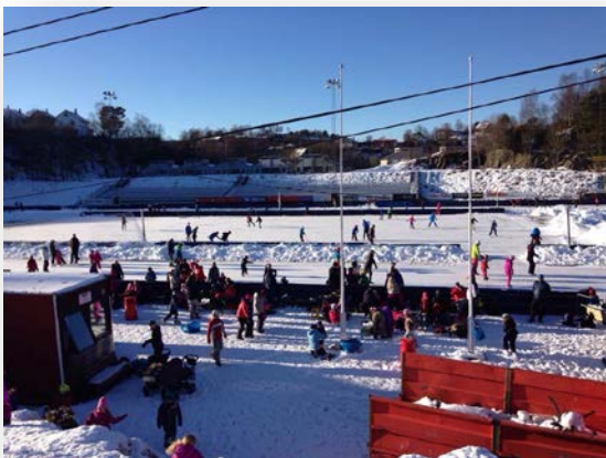
Slåtthaug kunstisbane: Det mest besøkte isanlegget i Norge