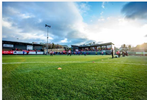
Nesttun Idretts plass (fotball): Trening, kamper og turneringer