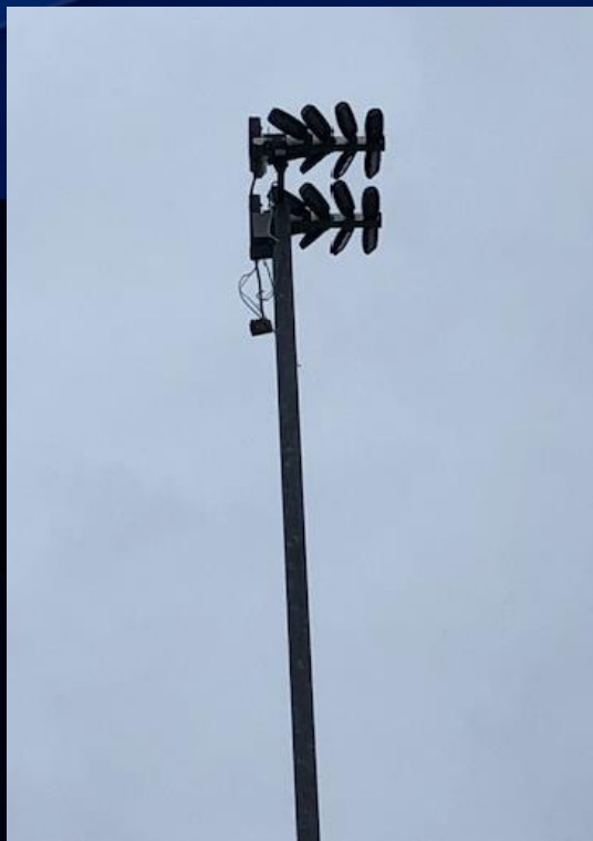
10. August 2023