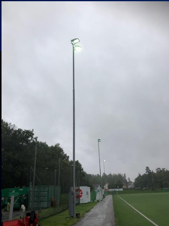
1. August 2023