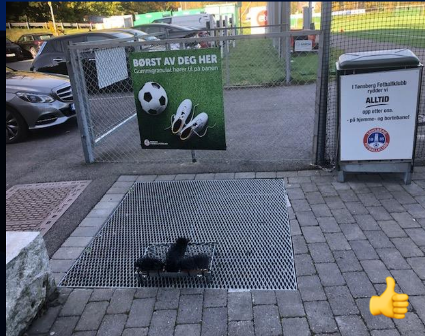
Installert rister med opplysningskilt