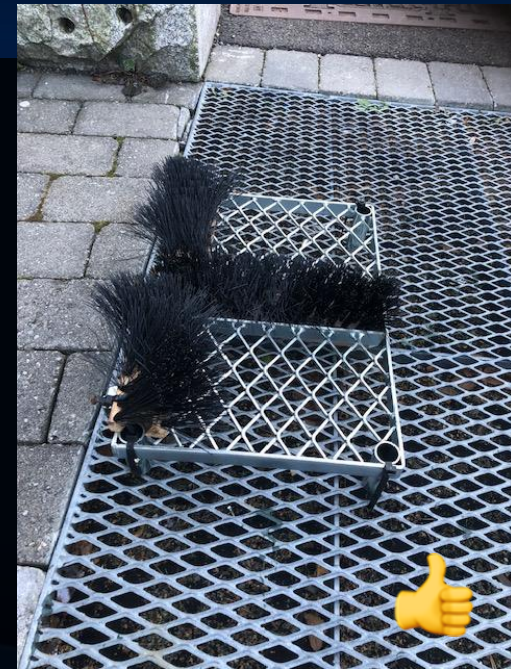
Kostene må byttes ofte