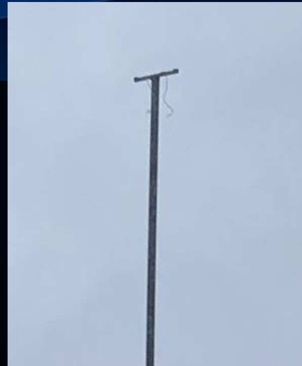
8. august 2023