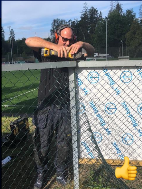
Stengt 5 sluser