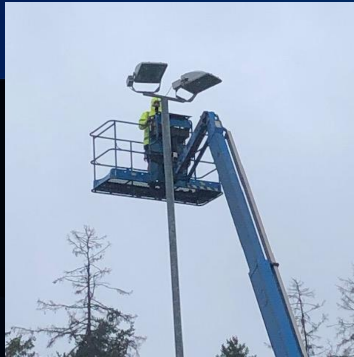
7. august 2023