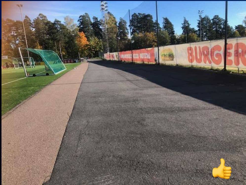
Asfalterte områder for snødeponi