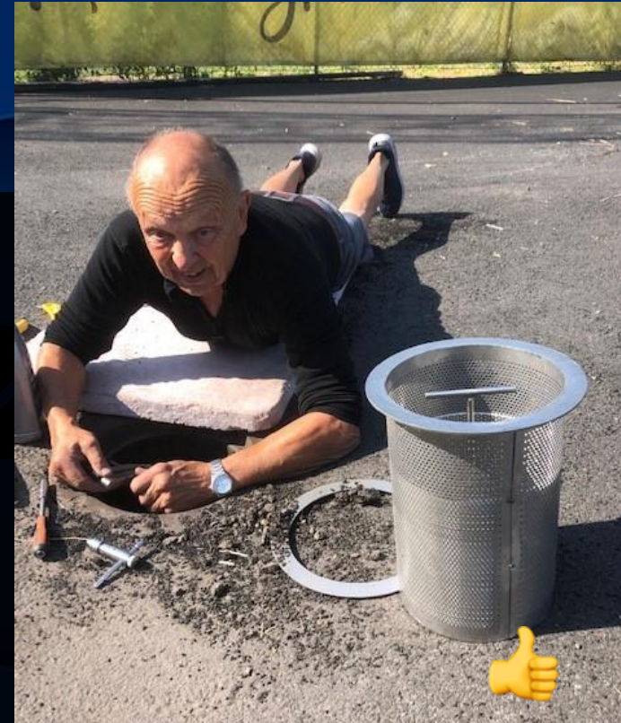
Installert filter i 9 drenskummer