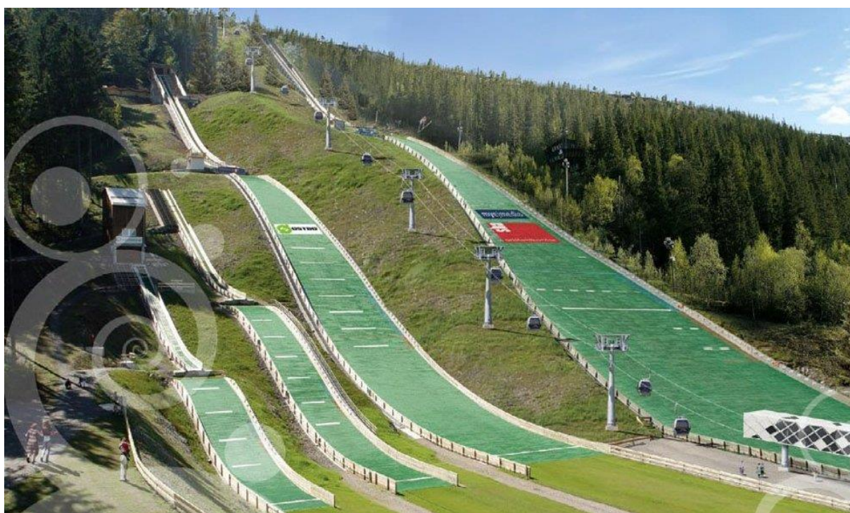
Fageråsen – Mo i Rana