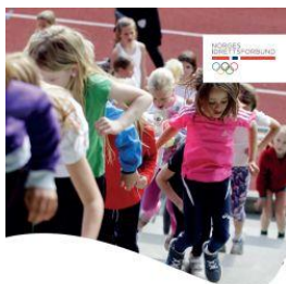
RAPPORT OM PENGENSPILL OG LOTTERIER I NORGE Rapport nr. 2, Februar 2015

Vi arrangerer nytt Lederkurs for ungdom i september 2015. Les mer om innholdet i kurset her .