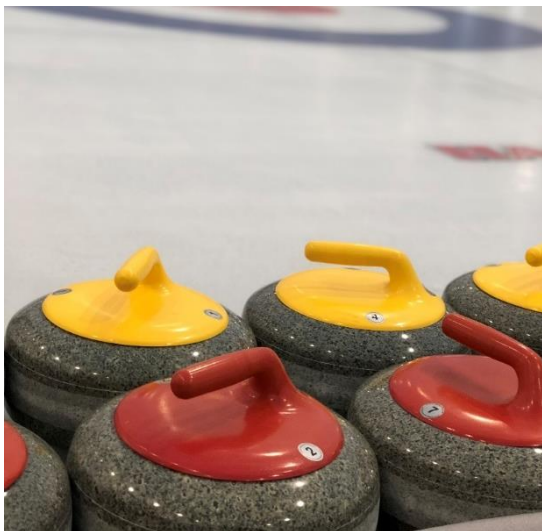
Bilde 3: Curling er en aktivitet man kan prøve i ishallen i Kristiansund.