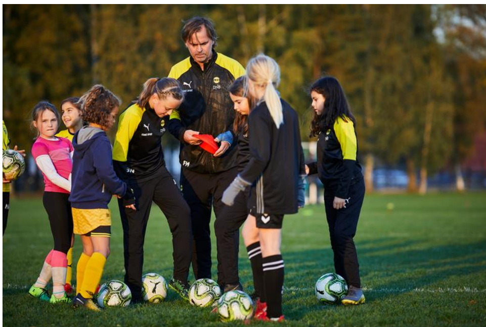
Bilde 2: Fotballaktivitet – treneren er viktig for samhold i laget.