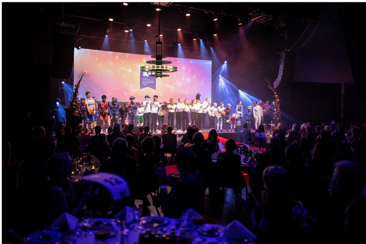
Bilde 1: Idrettsgalla og 100 årsjubileum 2019.

De strategiske satsingsområdene er sendt ut på høring i idrettsorganisasjonen og svarene fra høringen gjenspeiler satsingsområdene under disse.