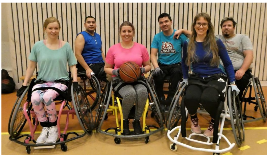
Bilde 4: Rullestolbasketspillere i Mauseidvåg og Solevåg IL, Foto: Per Einar Johannessen.