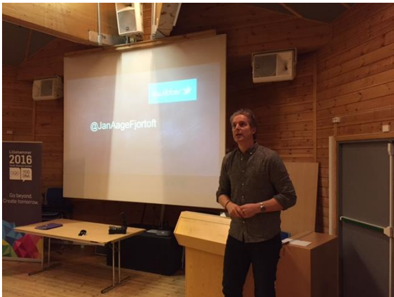
Jan-Åge Fjørtoft holdt et spennende foredrag om ungt lederskap.