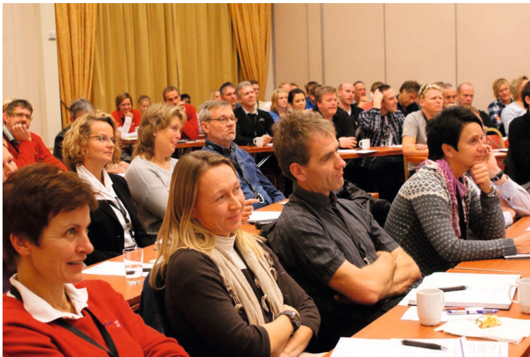
Trenerseminaret i regi av Hedmark Idrettskrets og Idrettens Kompetansesenter Innlandet, oktober 2010 samlet fullt hus på Rica Hotel Hamar.