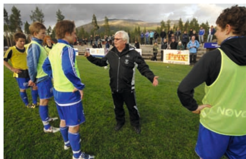
Nils Arne Eggen var i kanonform på Steimoegga idrettspark og på Aukrustsenteret.

Temaene på de enkelte arrangementene er fremkommet på bakgrunn av ønsker og behov som idrettslaget sjøl har definert. Mestring og en positiv prestasjonsutvikling har gått igjen som en fellesnevner for innholdet på alle arrangementene. Vi har hatt med oss profilerte personer med mye kunnskap og erfaringer på tematurneen. Rosenborgs trener Nils Arne Eggen var førstemann ut på Alvdal idrettslag sitt arrangement i 2009.