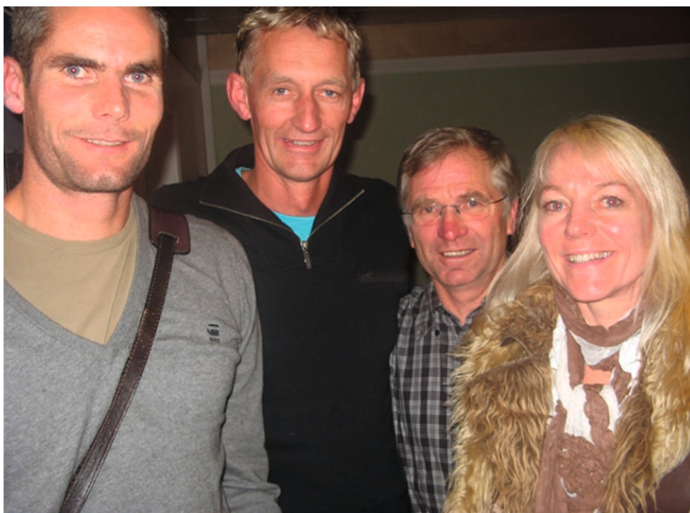
Thomas Alsgaard (fra v.), Ola Lunde, Arnfinn Kalfoss og Anita Moen på idrettens tematurne på Trysil-Knut Hotel.

Du må trene mye, ja svært mye, og med høy kvalitet! Det lønner seg å være smart.