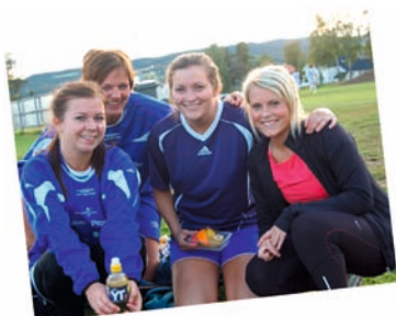
Unge jenter fra Brumunddal og Moelv fikk et innblikk i hvordan en kan trene opp hurtighet i fotball.

Kjetil André Aamodt pleide å levere i alpinløypa. Nå gjør han det også fra en talerstol. Vi spurte om hvordan han klarer å få det beste ut av seg sjøl når det gjelder som mest. Dette ble både lærerikt og inspirerende.