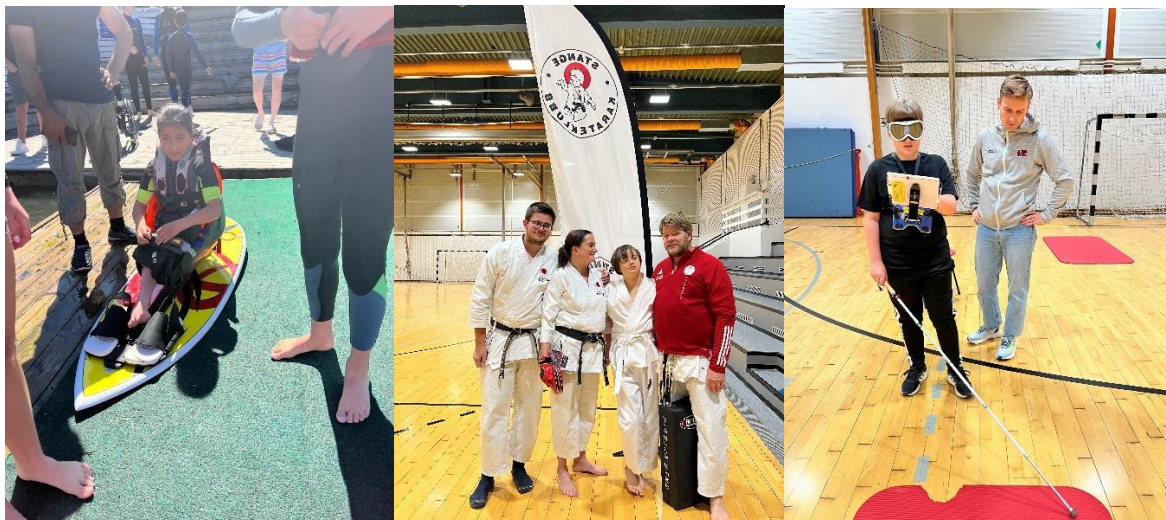
Bilde 1: Paracamp 2022, Bilde 2 og 3: Paradaag Gjøvik

IIK har fulgt opp enkeltutøvere ved direkte kontakt via epost, fysiske treffpunkt i idrettslag og telefonsamtaler, samt oppfølgings skjemaer fra rehabiliteringsinstitusjoner som Beitostølen Helsesportsenter og paraidrett.no