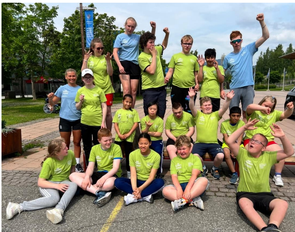
Bilde: Camp paraidrett 2022