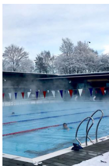
2018 - Gamlingen