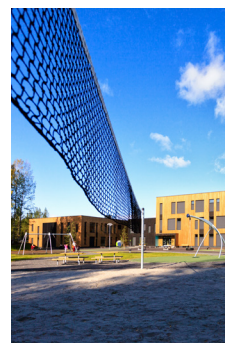
2020 - Skattekista