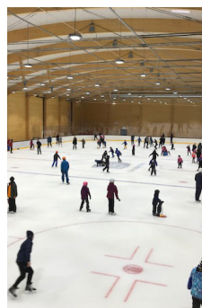
2019 - Bugården Ishall