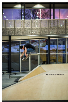
2017 - Oslo skatehall