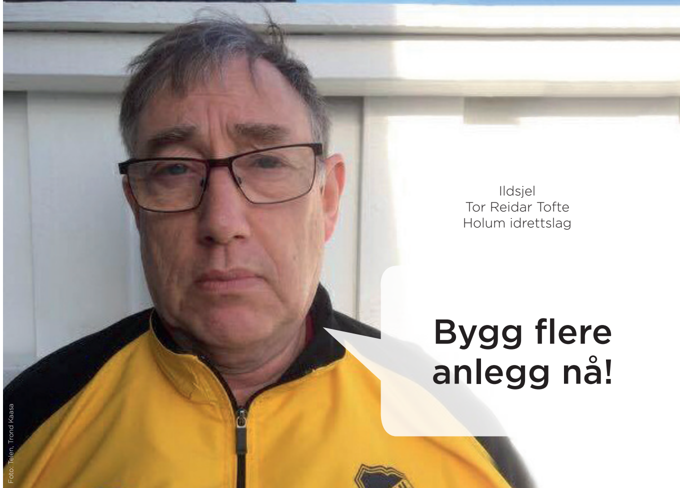
Ildsjel Tor Reidar Tofte Holum idrettslag