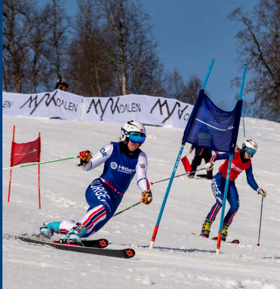
NM-veka 2022- Myrkdalen Voss