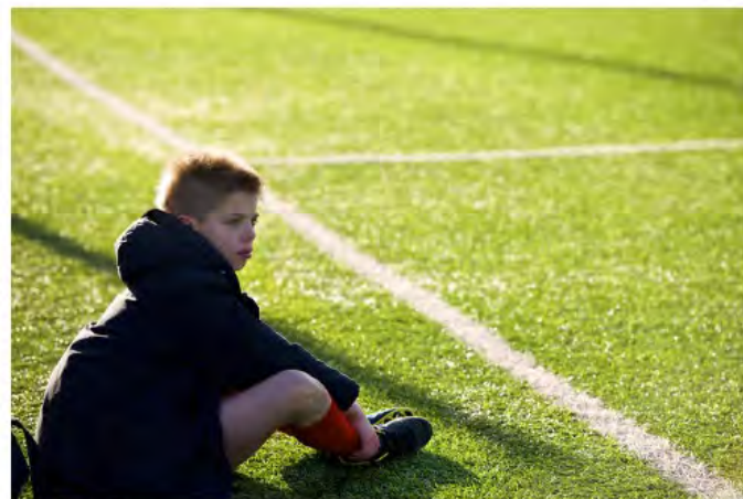
Lave søknadstall kan i neste omgang føre til redusert marked for mange entreprenører.

Blir det ringvirkninger for entreprenørene med halv aktivitet på idrettsanlegg?