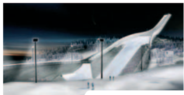
Kollen-publikummet kan glede seg til VM på ski i 2011.

Arbeidet med nasjonalanlegget har pågått for fullt i 2008. OIK er representert i referansegruppen for prosjektet ved styreleder og generalsekretær. I løpet av våren ble planarbeidet avsluttet. Vi hadde ingen innvendinger til det fremlagte planforslag med konsekvensutredning, og ga det