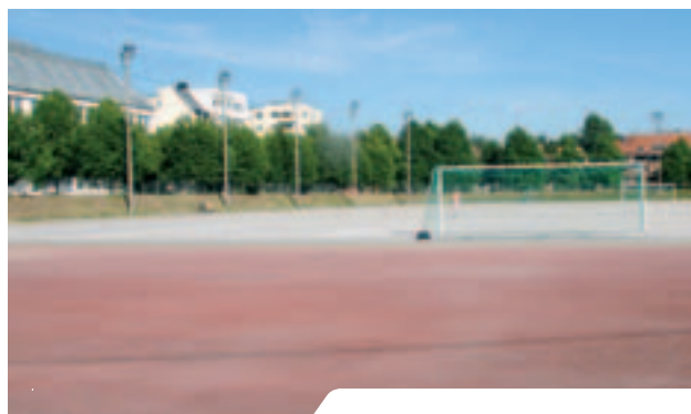
Frogner stadion skal rustes opp - ferdigstilles i 2010.

OIK uttalte seg på slutten av året til Riksantikvarens forslag om å frede Frognerparken med idrettsanlegg med hjemmel i kulturminneloven. Formelt ga vi et innspill til bystyrets behandling av Oslo kommunes høringsuttalelse. OIK ga her full støtte til byrådets prinsipielle standpunkt, at idrettsanleggene ikke bør inngå i områdefredningen, og at de følgelig bør tas ut. Byrådet henviste til behovet for at