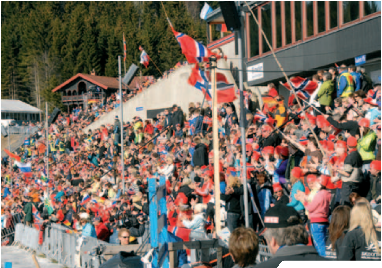
Byrådets budsjettforslag preges av investeringene i nasjonalanlegget i Holmenkollen.