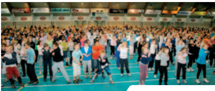
Felles oppvarming i Ekeberg Idrettshall under skoleidrettsdagen.

Den tradisjonelle utdelingen av statuetter og andre utmerkelser gikk av stabelen i Rådhuset 15. april med ca. 340 personer til stede. Utdelingen gjaldt som vanlig utmerkelser som var oppnådd året før. Til sammen 557 personer avla idrettsmerkeprøver i Oslo i 2007, noe som er en økning på 40 sammenlignet med 2006. Totalt var det 79 som var berettiget til en utmerkelse. Årets idrettsmerkeskip var i 2007 skoleskipet Sjøkurs. Det blir hvert år trykket en terminliste for idrettsmerkeprøver som sendes til interesserte. Den legges også ut på våre hjemmesider.