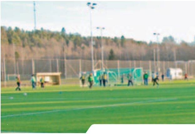
På de siste 15 årene er det anlagt 50 nye kunstgressbaner i Oslo.

og avsetninger, foreslo dette flertallet 74 mill. kr til en rekke breddeidrettsanlegg: