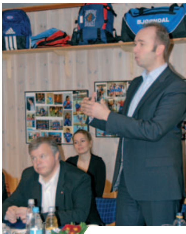
I forbindelse med presentasjonen av Bjørndal IFs engasjement for integrering og arbeid i Osloiddrettens Storbyprosjekt stilte to statsråder opp på Bjørndal i januar. Her arbeids- og inkluderingsminister Bjarne-Håkon Hansen og kultur- og kirkeminister Trond Giske.

I slutten av april ba NIF om vårt syn på kulturomsutvalgets forslag (NOU 2008:7 Kulturomsutvalget). I sitt svar i mai støttet styret prinsipielt særmerknaden fra representantene for