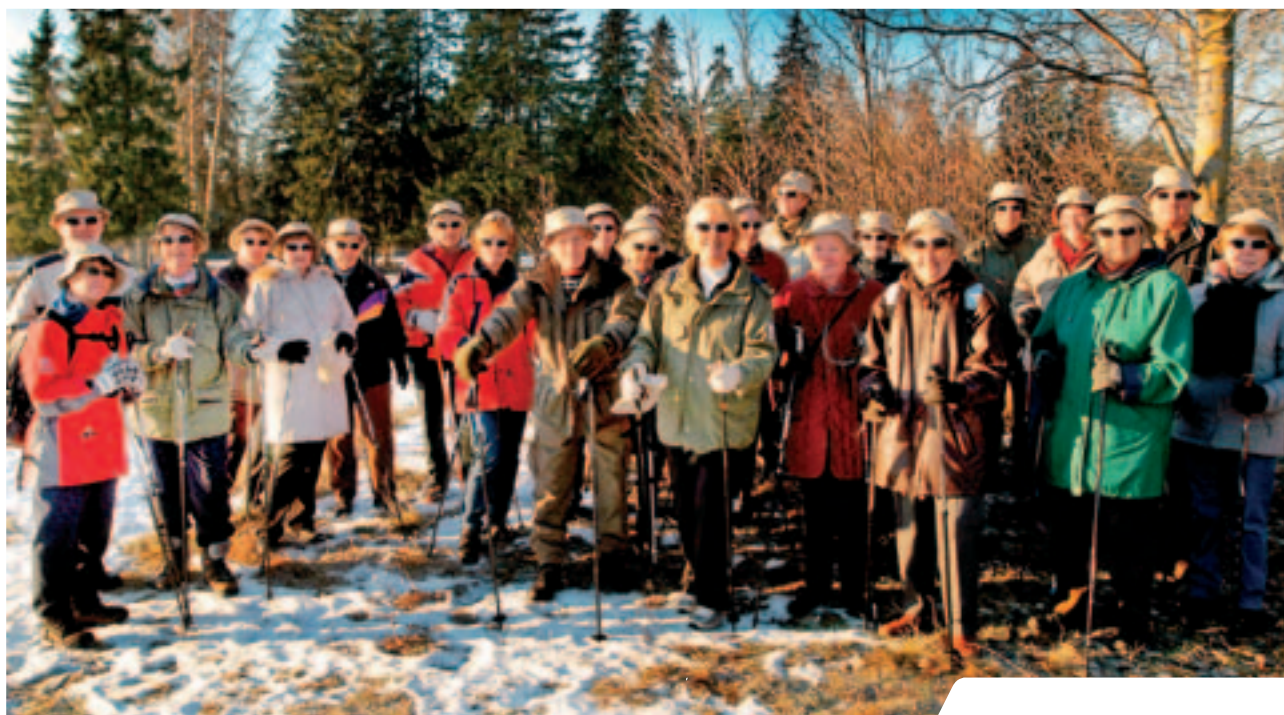
Oslo Idrettskrets fordeler nærmere en million kroner til 60pluss-grupper over hele byen.

etablert på slutten av året. Aktivitetene som tilbys er turgåing med og uten staver, svømming, vanngymnastikk, trim til musikk, gymnastikk, dans, qigong, yoga, fotball og roing. I tillegg arrangeres sosialiserende bussturer og foredrag om bl.a. verdien av fysisk aktivitet og sunt kosthold.