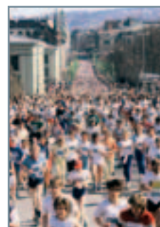
Forsiden: Sentrumsløpet på Karl Johan samler mange deltagere.