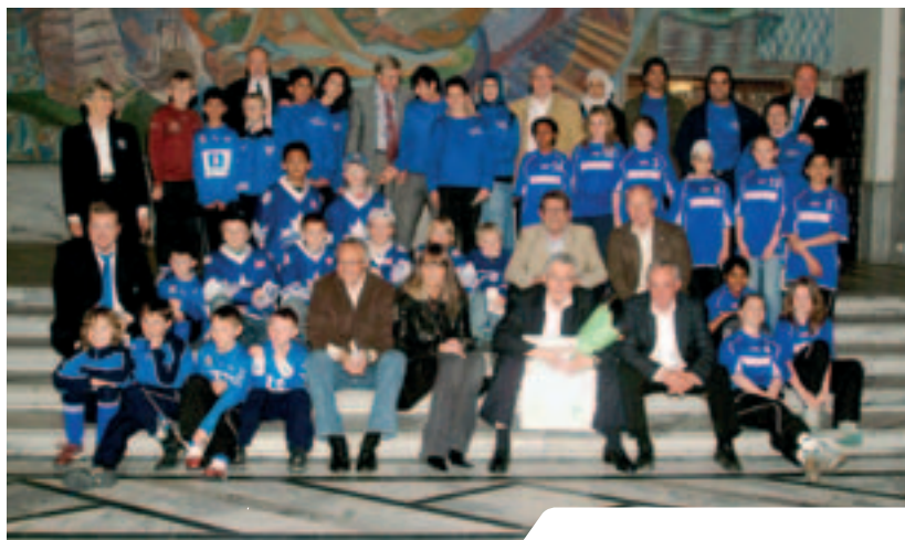
Oslo kommunes pris til Årets idrettslag 2006: Furuset Idrettsforening