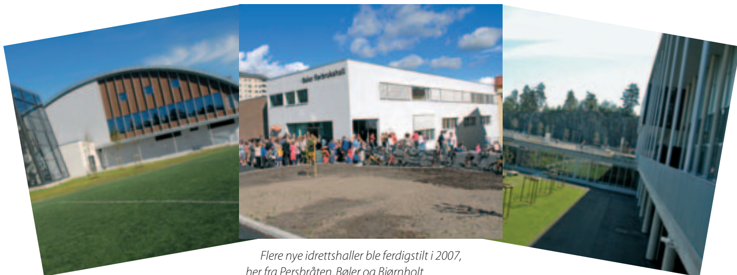
Flere nye idrettshaller ble ferdigstilt i 2007, her fra Persbråten, Bøler og Bjørnholt.

Samarbeidet med kommunens administrasjon, etater og foretak er fortsatt nært og godt. Spesielt gjelder dette Kultur- og idrettsetaten, Park- og idrett Oslo KF, Undervisningsbygg Oslo KF og Byrådsavdeling for næring og kultur. OIK har også gode forbindelseslinjer til Utdanningsetaten, Plan- og bygningsetaten, Eiendoms- og byfornyelsesetaten og Omsorgsbygg Oslo KF. Vi samarbeider dessuten utmerket med private aktører, konsulenter, entreprenører, arkitekter og andre som fungerer i markedet. Det samme gjelder vårt forhold med Kultur- og kirke departementet, særforbund og andre idrettsrelaterte organisasjoner.