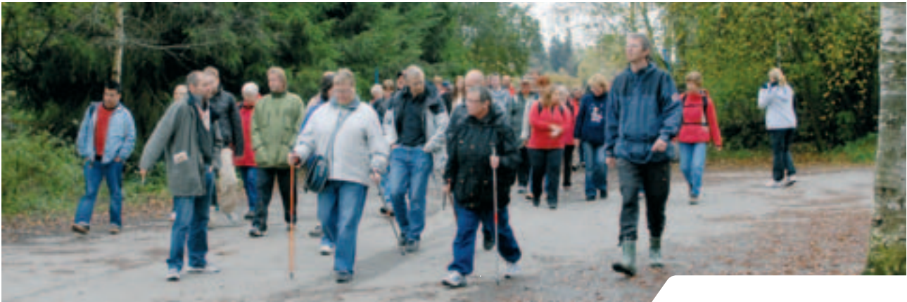
Rekordmange deltok i turmarsjen som Aktiv på dagtid arrangerte i anledning Verdensdagen for psykisk helse.

gymsaler. Etter forslag fra styreutvalget vil man i 2008 etablere bydelsvise oversikter som viser lagenes aktivitetstilbud.