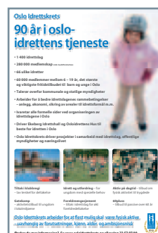
Baksiden: Oslo Idrettskrets fylte 90 år i 2007. Dette ble blant annet markert med denne annonsen.

Årsberetning 2007 – Oslo Idrettskrets, Ekebergveien 101, 1178 Oslo.