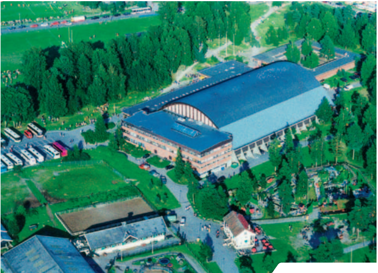
Osloidrettens Hus og Ekeberg Idrettshall er et samlingspunkt for idretten i hovedstaden.