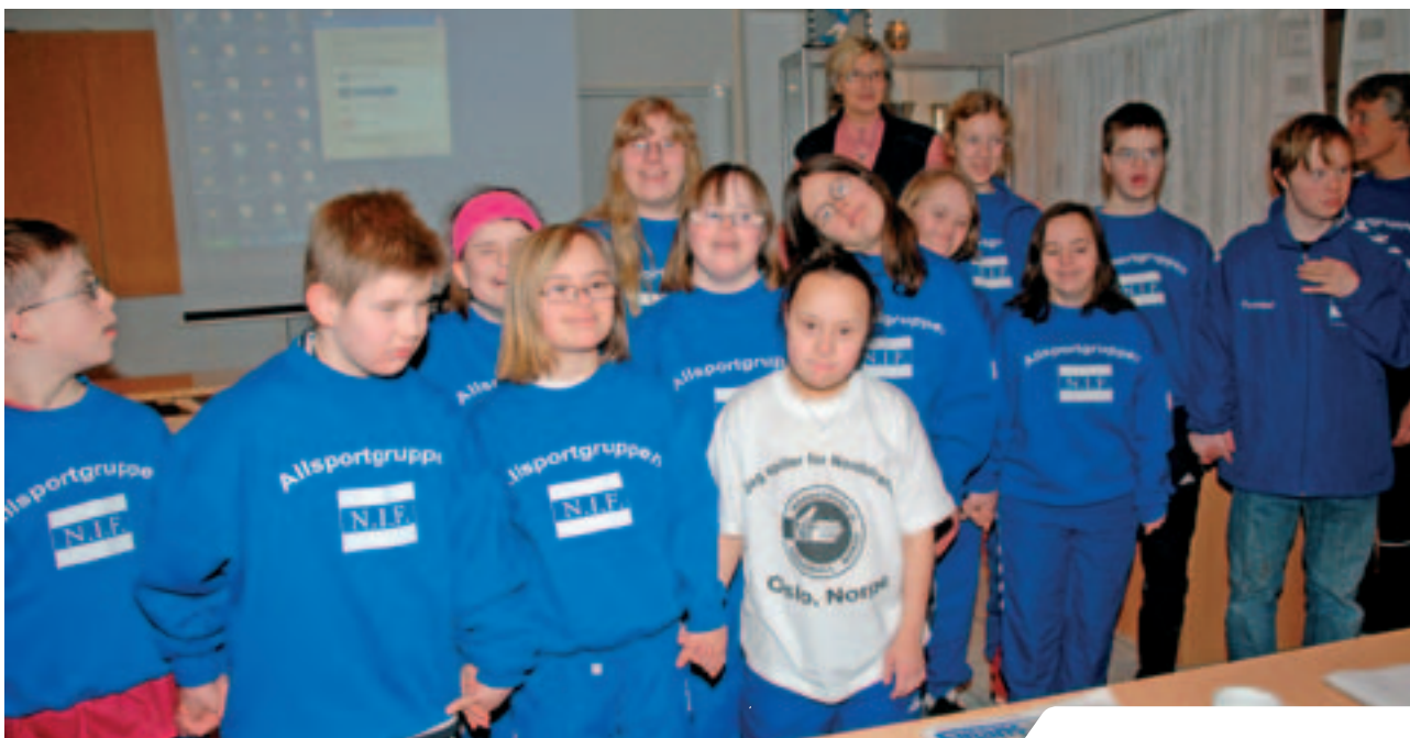
Stolte medlemmer av Nordstrands IFs allsportgruppe for barn, som deltok på filmen om idrett for utviklingshemmede.