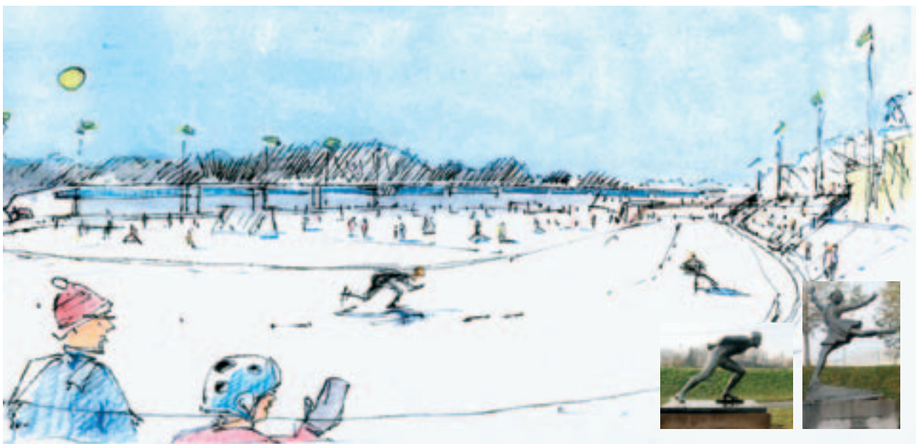
Illustrasjon for nye Frogner stadion. Innfeldt skulpturene av Oscar Mathisen og Sonja Henie.

Ellingsrud, Voksen og Lerskallen, vil være ferdig regulerte i løpet av 2007. Er vi heldig med fremdriften, kan den første spadensetningen i jorden senhøstes 2007. Målet er å realisere seks nye idrettshaller i løpet av 4-6 år.