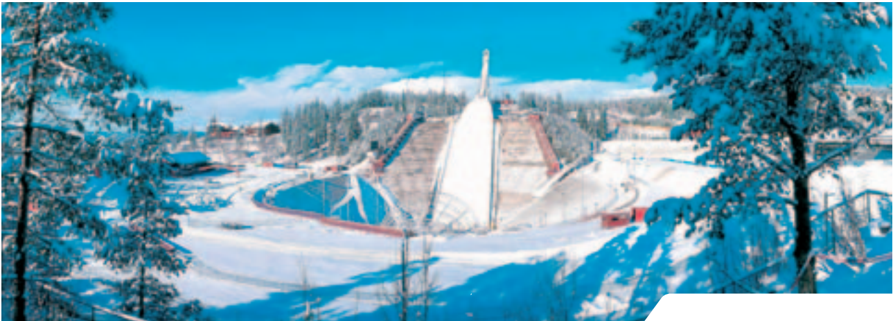
Norge ble tildelt ski-VM, nordiske grener for 2011 og det skal de kommende årene bygges ny Holmenkollbakke.