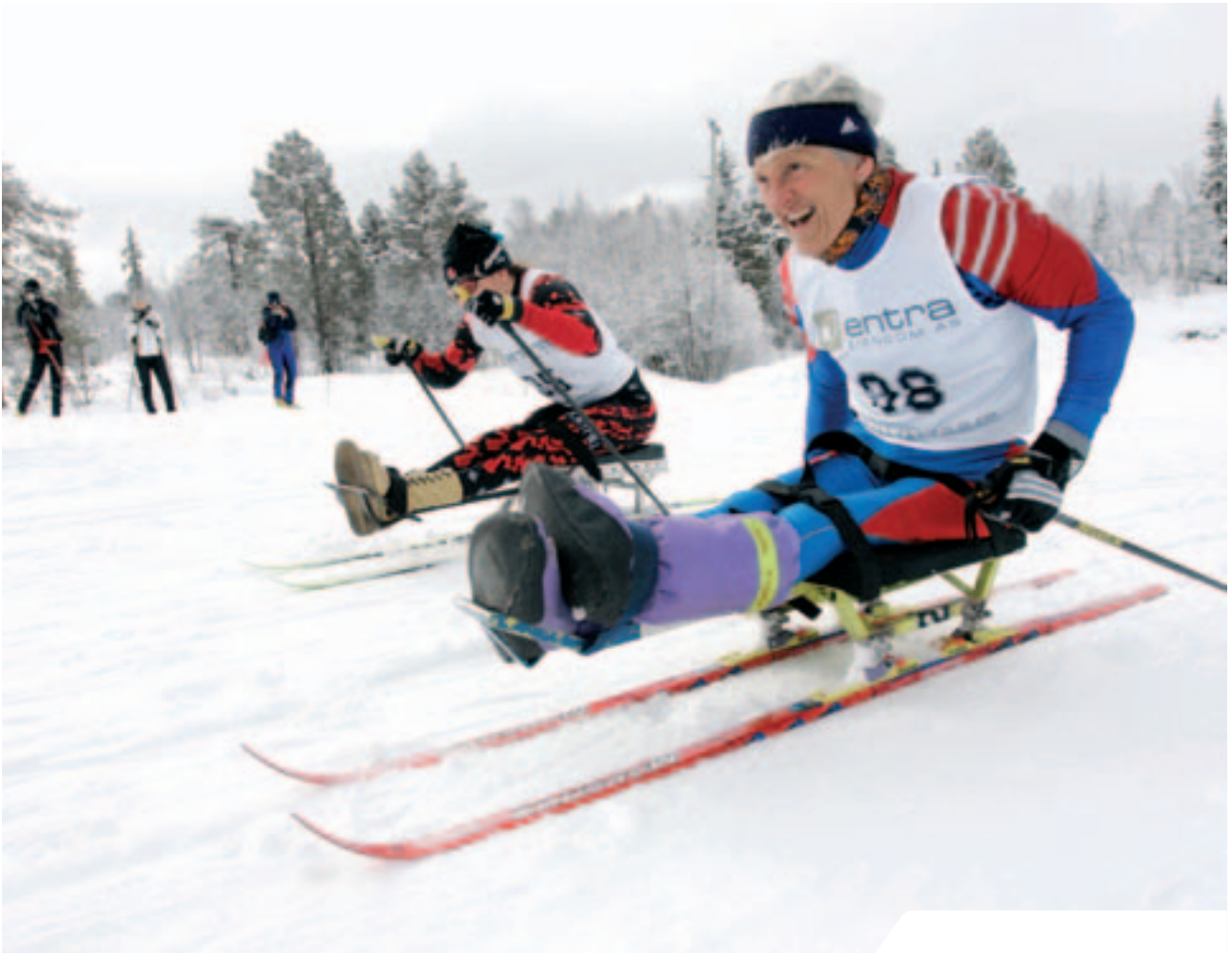
Oslo Idrettskrets ønsker flere funksjonshemmede med i idrettsaktiviteter.

man turgåing, stavgang, svømming, vanngymnastikk, trim til musikk, gymnastikk, qi gong, yoga, fotball, roing, treningsstudio, bussturer, temakvelder og dans.