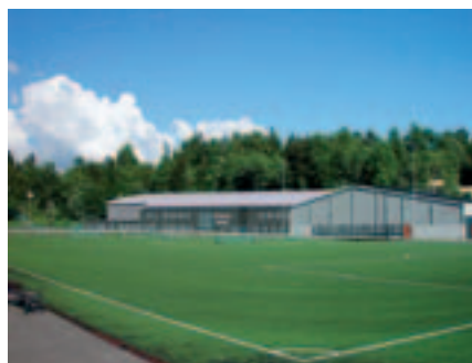
Slik er den nye Heminghallen planlagt utvendig og innvendig.

Styret mener forøvrig at OIK nå har en vidtfavnende prosjektportefølje som når store og viktige målgrupper. Vi har all grunn til å være stolte av det arbeid som gjøres av lagene og de prosjektansatte. Prosjektene tilbyr aktivitet ut over lagenes ordinære medlemstilbud og finansieres i sin helhet av særskilte offentlige bevilgninger og sponsormidler.