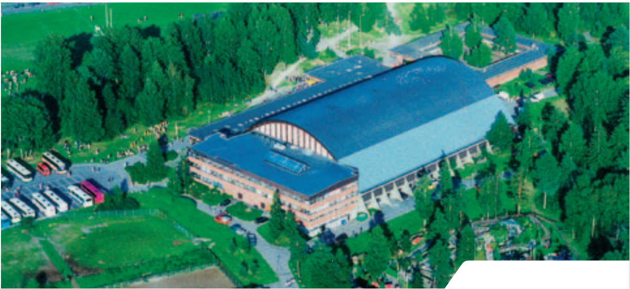
Osloiddrettens Hus og Ekeberg Idrettshall er et samlingspunkt for idretten i hovedstaden..

Totalt har det deltatt 256 personer på utdanningstiltak i OIK regi i 2006.