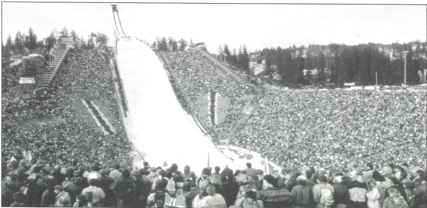
I 1992 feiret Holmenkollbakken 100-års jubileum.

Styringsgruppene informasjon og markedsføring innstilte dessuten en vinner av prisen "Årets Idrettslag" som ble opprettet i 1992. Kretsstyret vedtok at prisen i 1992 skulle gå til Tøyen Taekwondo Klubb.