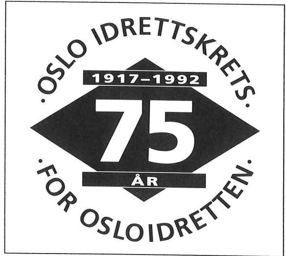
Oslo Idrettskrets jubileumslogo.

Jubileumsmiddagen ble holdt p  Rica Sjølyst med over 200 gjester tilstede. 28 s rkretser har gjennom hele  ret hatt forskjellige idrettsarrangementer hvor OIKs 75- rs jubileum har v rt markert. F rst ut var Oslo Fotballkrets med sin juleturnering og Oslo Ishockeykrets avsluttet jubileumsarrangementene med Oslo Cup. Per Jorsett redigerte OIKs jubileumsbok "Osloidrettens historie